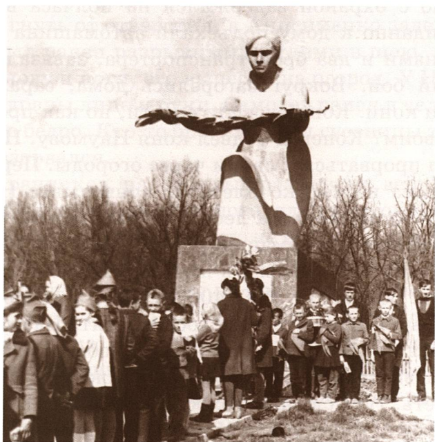
Памятник партизанам-наумовцам, погибшим у с. Шляховая в жестоком бою 6 марта 1943 г.

Весь дневной путь партизан сопровождали гитлеровские самолеты, пришлось рассредоточиться. Развернутым строем прошли много сел, остановились в селе Грузное на стыке Николаевской, Кировоградской и Одесской областей.