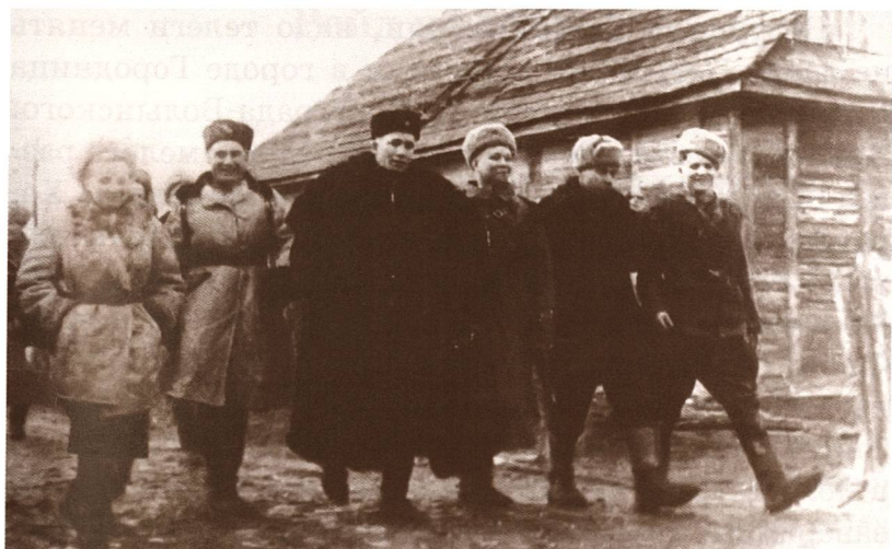
Группа руководителей кавалерийского партизанского соединения М. И. Наумова в освобожденном селе Буки. Декабрь 1943 г.

Эсэсовцы прямо с машин открывали огонь из автоматов. Партизаны укрылись в разрушенном укрепленном районе.