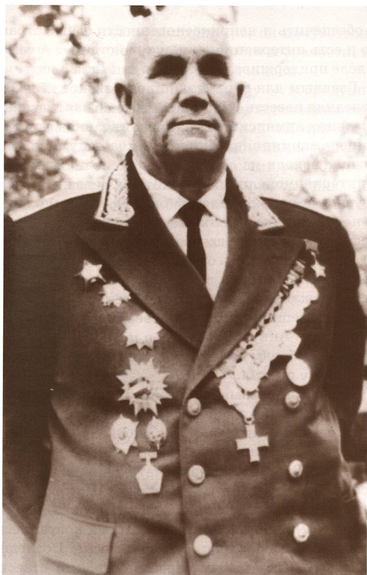
Герой Советского Союза генерал-майор М. И. Наумов. 1965 г.