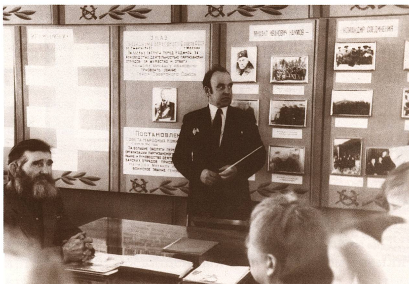
У стендов школьного музея