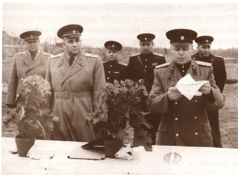
Группа офицеров управления внутренних войск Киевского округа при подведении итогов стрелковых соревнований в воинской части № 3217. 22 апреля 1957 г.

здоровья вышел в отставку, полностью занялся писательским трудом, чтобы увековечить память о подвигах своих однополчан, выполнить данные в боевые годы обещания. И вот писатель, командир, герой вновь шагает по тропам партизанских рейдов, переживает свои удачи и неудачи, успехи и промахи своих друзей и соратников, и все это ложится на бумагу. В 1954 году появляется первая книга «Хинельские походы» — о первом периоде партизанской жизни. В 1961 году выходит вторая книга «Степной рейд». Через несколько лет издана третья книга «Западный рейд» — о завершающем рейде наумовцев.