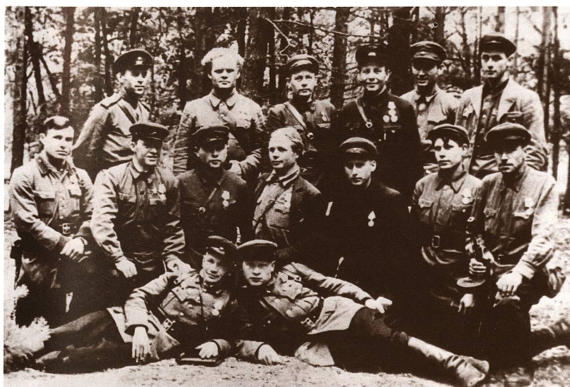
Личный состав радиоузла соединения

динения пошли подпольщики, представители отрядов и групп.