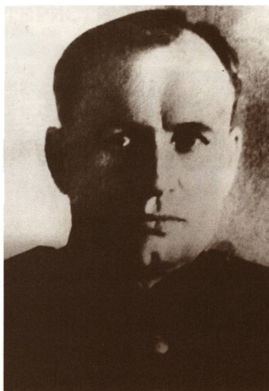
Тимор Авросимович Строкач, генерал-лейтенант, начальник штаба партизанских соединений Украины

ему устанавливать взаимодействие с Красной армией. 30 мая 1942 года создается Центральный штаб партизанского движения во главе с секретарем ЦК компартии Белоруссии. Такие же штабы были созданы в республиках и в некоторых областях. Украинский штаб партизанского движения (УШПД) возглавлял генерал-лейтенант Т. А. Строкач.