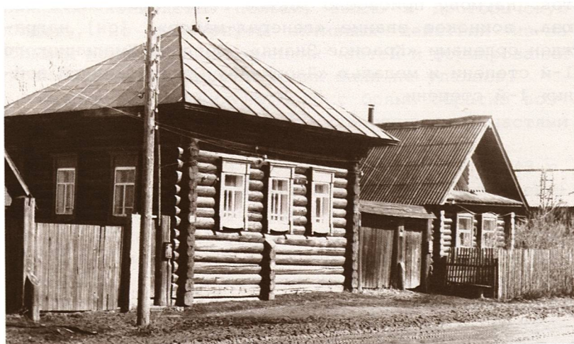
Родительский дом, начало начал...