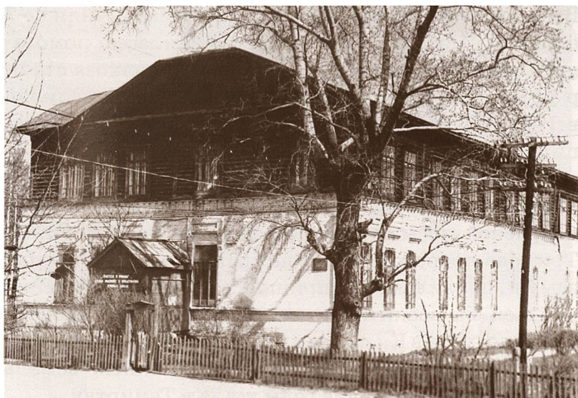
Школа в Большой Соснове, в которой начал учиться М. И. Наумов

хозяйством, и ремеслом. Он выделывал кожи и шил кожаную обувь, его изделия славились, поэтому ему часто заказывали сапоги или ботинки зажиточные крестьяне.